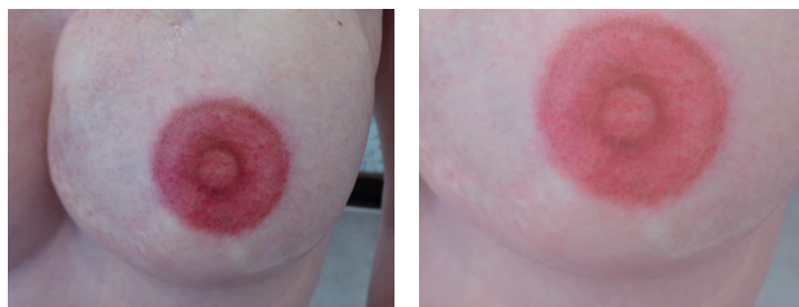
Fot. 1 Brodawka i pierś przed i po zabiegu.